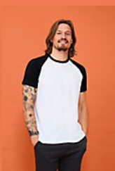
SOL'S FUNKY 11190